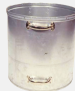
Separater Stahlzusatzbehälter für besonders sicheres Handling von beispielsweise Dosen und Gläsern nach der Verdichtung.