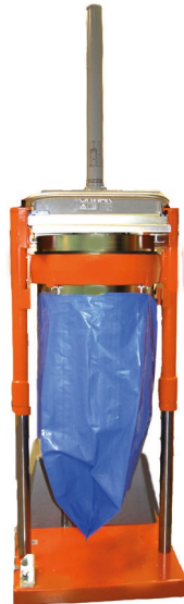
Standardhöhe für die Entleerung 2.660 mm

Als Top-Lader ist die Presse einfach zu befüllen. Sie ist sicher und einfach zu bedienen und macht den Sackwechsel mit ihrer eingebauten Hebefunktion denkbar schnell und bequem.