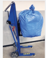
Die Orwak Hebekarre macht die Bedienung noch bequemer und Schluss mit schwerem manuellem Heben